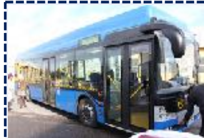
Errichtung und Betrieb von Ladeinfrastruktur für Elektrobusse in Vorarlberg