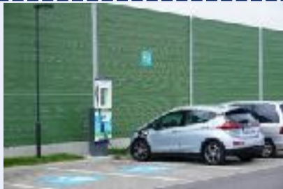
Erster High-Power-Charger an der Autobahn in Österreich