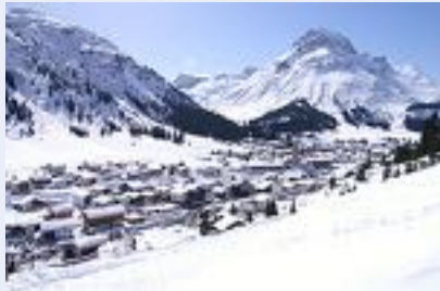
Erste vollelektrifizierte Tiefgarage in Urlaubsregion Lech