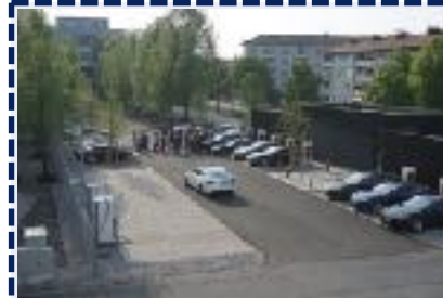
Größter Tesla Supercharger in Mitteleuropa